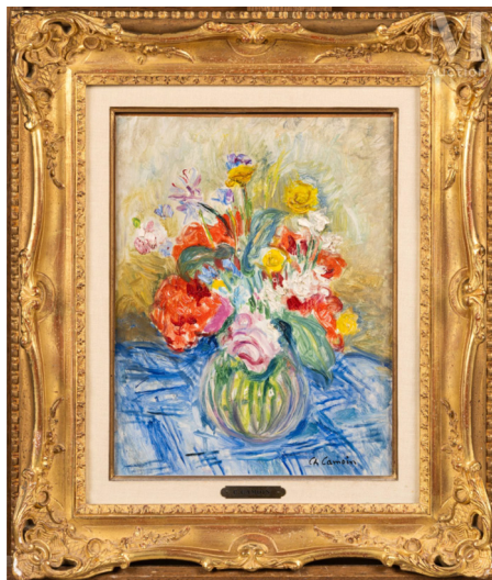
Charles Camoin "Fleurs dans le vase en verre sur nappe à carreaux", vers 1941. Huile sur papier marouflée sur toile. 35 x 27 cm. Signé en bas à droite Estimation : 6.000 - 8.000 €