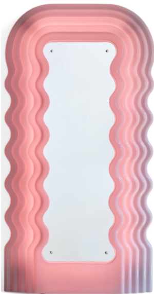
Ettore Sottsass Miroir éclairant "Ultrafragola" Édition Poltronova, vers 1970 H. : 195 cm Estimation : 3.000 - 4.000 €

■ François Epin Auction - Tél. : 06.16.50.30.63