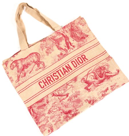
Christian Dior Sac Dioriviera en toile beige à imprimé rouge félins 42 x 37 x 13 cm Estimation : 100 - 200 €