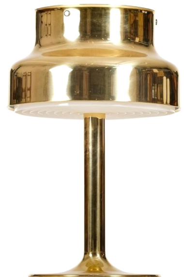
Anders Pehrson Lampe de table Bumlingen Laiton Édition Ateljé Lyktan, vers 1970 H. : 62 cm