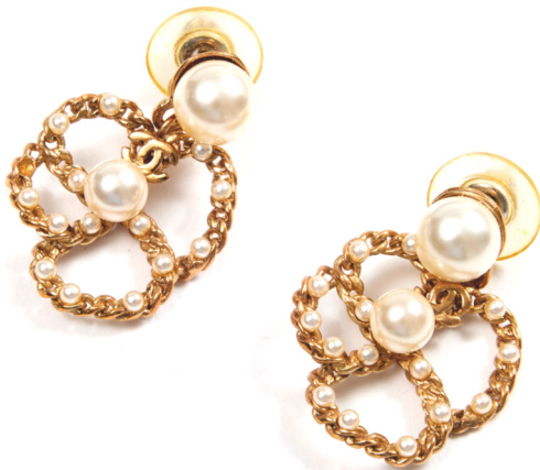
Chanel Paires de boucles d'oreilles en métal doré à décor de camélia façon chaîne rehaussée de perles fantaisies. Signée Estimation : 100 - 150 €