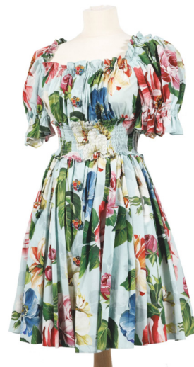
Dolce & Gabbana Robe en coton vert d'eau imprimé de grosses fleurs Taille 38 Estimation : 60 - 80 €

■ Auction Art Rémy Le Fur & Associés - Tél. : 01.40.06.06.08