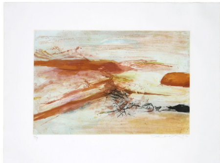
Zao Wou-Ki Sans titre, 1994 Eau-forte et aquarelle en couleurs sur papier Numéroté sur 99, daté 94 et signé en bas à droite 57 x 71.5 cm Estimation : 1.300 - 2.300 €