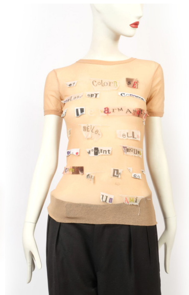
Jean Paul Gaultier T-shirt en Mesh nude agrémenté de collages Estimation : 50 - 80 €

■ Gros & Delettrez - Tél. : 01.47.70.83.04