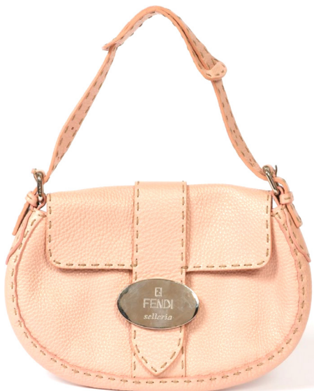
Fendi Sac baguette en taurillon rose nacré Fermeture languette sur médaillon en métal argenté, anse d'épaule - 28cm Estimation : 300 - 500 €