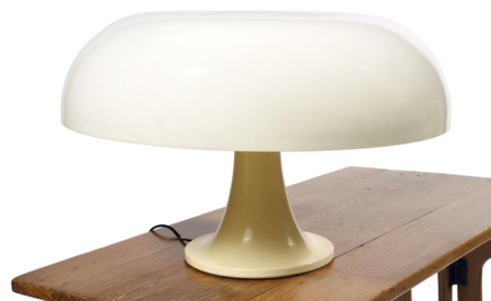
Giancarlo Mattioli Lampe de table modèle Nessino en polycarbonate D. : 32 cm Estimation : 50 - 100 €

■ Digard Auction - Tél. : 01.48.00.99.89