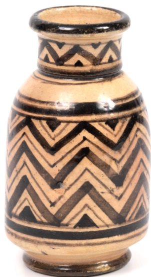
Boujemaa Lamali (attribué à) Petit vase sur talon Céramique à décor émaillé de chevrons noir sur fond crème Signé sous la base - H. : 11,53 cm Estimation : 50 - 80 €

■ Drouot Estimations - Tél. : 01.48.01.91.00