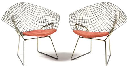
Harry Bertoia Paire de fauteuils modèle Diamond Fil de fer soudé et piétement en métal chromé 75 x 85 x 70 cm Estimation : 100 - 200 €