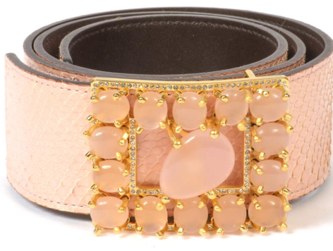
Valentino Ceinture en Python lustré rose Boucle en métal doré ornée de perles en résine rose - T.80, 49mm Estimation : 40 - 60 €