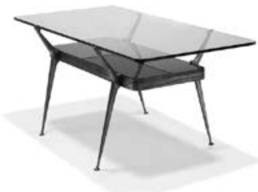
Cesare Lacca Table basse, circa 1955 Laiton et verre Estimation : 1 500 € - 2 000 €