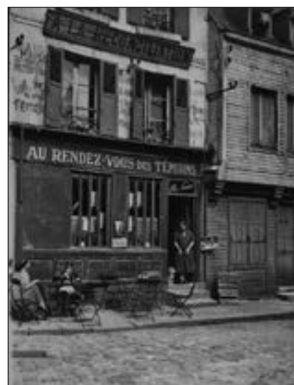
René-Jacques Sans titre, "Paris" - Tirage argentique 51 x 40,7 cm Estimation : 200 € - 300 €