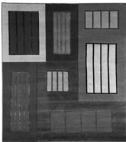
Peter Halley et Chevalier édition Tapis rectangulaire "Prison 2", 2010 Tissé main à points noués en laine et soie, teintes polychromes - Édition 2/8 Estimation : 7 000 € - 9 000 €