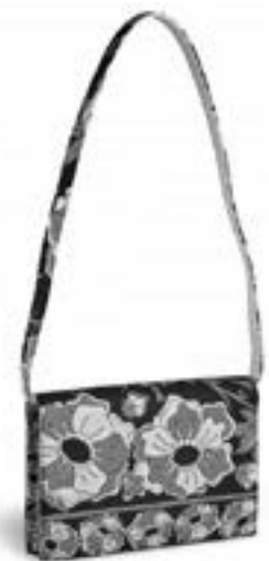
Emilio Pucci Sac du soir en soie imprimé Estimation : 80 € - 100 €