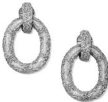
Paire de créoles en or jaune 18K Travail français, vers 1960 Poids : 28,86 g Estimation : 1 000 € - 1 200 €