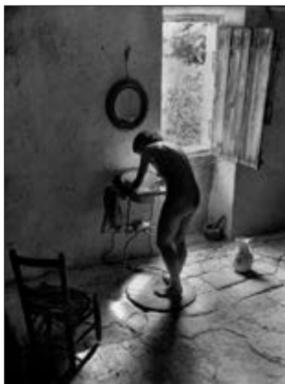
Willy Ronis Le Nu Provençal, 1949 - 40 x 30 cm Tirage argentique postérieur Estimation : 3 000 € - 4 000 €