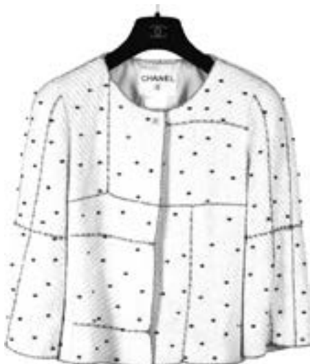
Chanel Circa Collection Croisière 2000 Veste en tweed de coton écru et rouge - Taille 40 Estimation : 450 € - 550 €