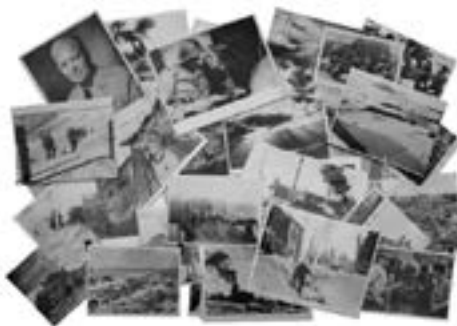
Ensemble de plus de quarante photographies sur la Seconde Guerre Mondiale Tirages argentiques Estimation : 450 € - 600 €