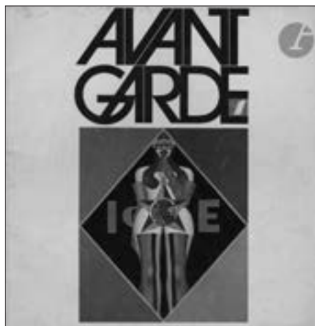
Avant-garde Éditions originales brochées Magazine publié en 14 volumes entre 1968 et 1971 Estimation : 300/400 €