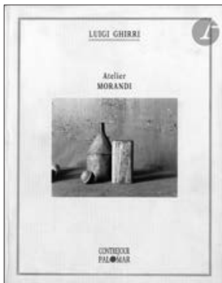
Luigi Ghirri Atelier Morandi Contrejour/Bari, Palomar, Paris, 1992 Édition originale brochée, 90 pages Estimation : 250/300 €