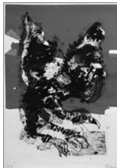
Fred Kleinberg Composition, 2001

Lithographie sur papier signé, titré et daté dans la planche en bas à droite Éditeur Heidi Weber, Zurich - 71 x 103 cm Estimation : 600/800 €