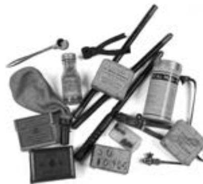
Lot de matériel Estimation : 100/200 €