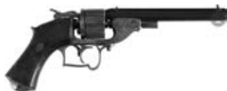
Revolver à percussion système Lagrèze, six coups, calibre 12 mm Estimation : 800/1 200 €