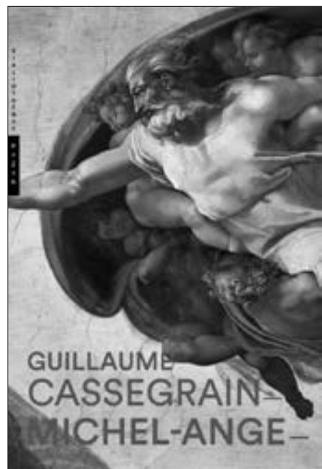
Éditions Hazan - 320 pages - 30 €

Précédé d'une étude de l'auteur sur le thème abordé dans chaque chapitre, ce corpus est constitué d'archives pour la plupart, inédites ou épuisées. Elles regroupent aussi bien des passages de traités esthétiques du 16ème siècle (Condivi, Vasari, Danti, Varchi) que des lettres ou des poèmes de l'artiste.