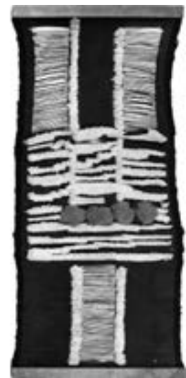
Tapisserie murale en laine polychrome 85 x 200 cm Estimation : 250/350 €