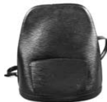
Sac à dos «Gobelin» 31cm en cuir épi noir Estimation : 400/500 €