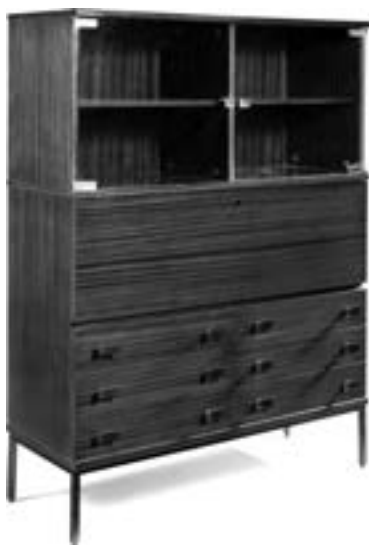
Antoine Philippon et Jacqueline Lecoq Meuble de rangement formant secrétaire à tiroirs en placage d'acajou, verre et laiton Edition Jules Degorre, vers 1955 Estimation : 400/600 €