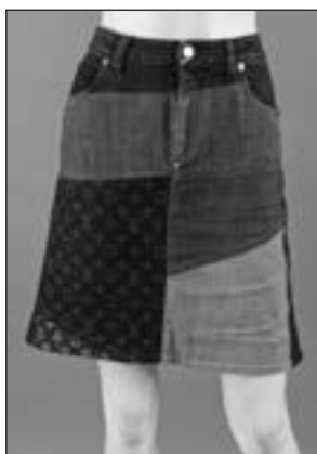
Louis Vuitton par Julie de Libran Collection Resort 2014 Mini-jupe en patchwork de denim taille 44 Estimation : 100/120 €