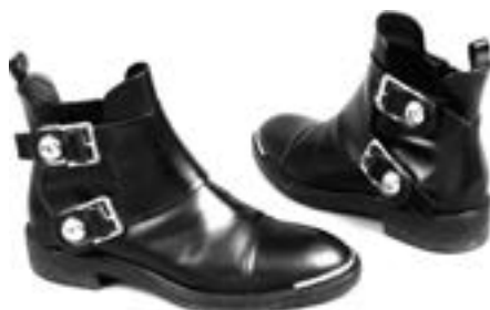
Louis Vuitton par Marc Jacobs Collection Printemps/Été 2014 Paire de boots zippées en veau mat noir taille 39 Estimation : 300/350 €