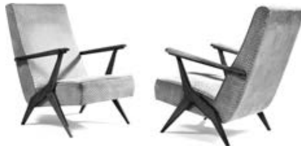
Antonio Gorgone pour la Casa del Sole à Cervinia en Italie Paire de fauteuils en hêtre et tissu crème nuancé brun. Modèle créé entre 1947 et 1955 Estimation : 1 500/2 500 €