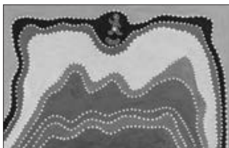
Madigan Thomas (Gija) Sans titre, 2007 Ocre sur toile - 70 x 45 cm La peinture porte au dos les références suivantes : Madigan Thomas WAC 510/07 Estimation : 1 500/3 000 €