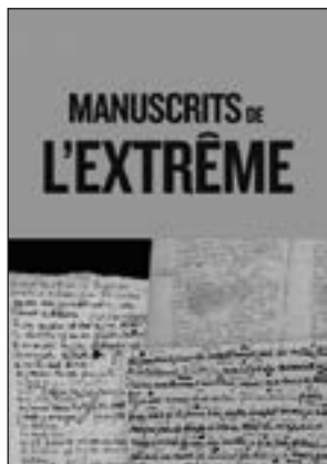
BNF éditions - 208 pages - 29 €

Chargés d'une émotion palpable, ces documents racontent la nécessité d'écrire pour faire face aux drames de la vie.