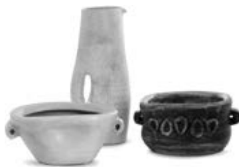
Mado Jolain Coupe rectangulaire en faïence, émail extérieur ivoire, intérieur jaune. Coupe quadrangulée en terre chamottée, émail brun rougeâtre sur fond crème Estimation : 1 200/1 500 €