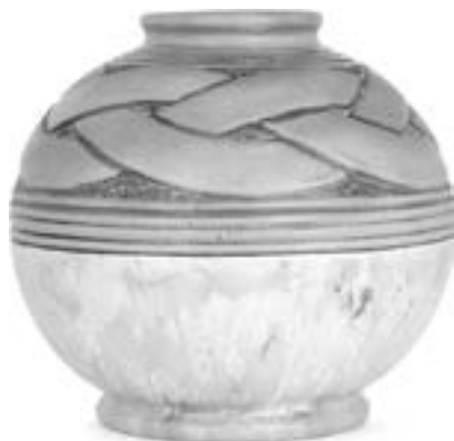
Joseph et Pierre Mougin - Geo Condé Vase sphérique en grès sur talon, émaux verts, partie inférieure à décor émaillé beige partiellement cristallisé. Signature de cachets "Grès Mougin Nancy 188 J Condé dc" Estimation : 200/300 €