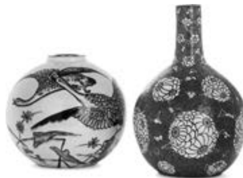
Henri Chaumeil. Pied de lampe sphérique aplati, émaux roses, gris et noirs sur fond blanc craquelé. Vase sphérique, décor d'inspiration chinoise de grands motifs fleuris sur fond de feuillages, émaux verts et blancs sertis bruns sur fond bleu Estimation : 150/200 €