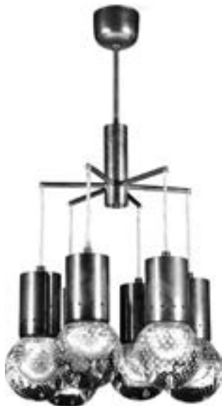
Gino Sarfatti (1912-1985) Suspension Laiton, verre H.: 75 cm - Arteluce, circa 1962 Estimation : 2 000/3 000 €