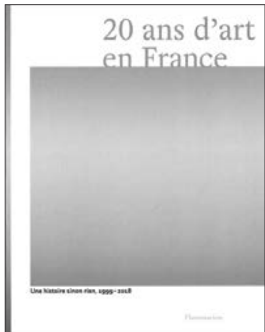
Éditions Flammarion - 296 pages - 49 €

Livre d'images avant tout, rassemblant un vaste corpus de vues d'exposition, cette histoire, riche et diverse, rend sensibles les lignes de force et les mutations d'une création contemporaine telle que l'auront portée plusieurs générations d'artistes en ce début du 21ème siècle.