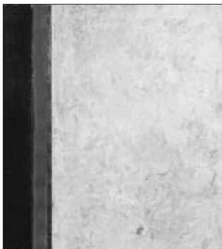
Composition, 2002 Huile sur panneau monogrammé et daté au dos 103 x 93 cm Estimation : 150/200 €