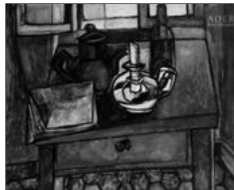
Cuisine, 1959 Huile sur toile Monogrammée, datée et tirée au dos 81 x 100 cm Estimation : 300/400 €