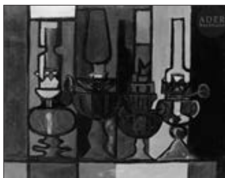
Lampes à huile, 1952 Huile sur isorel Signée et datée en bas à gauche 72 x 91 cm Estimation : 300/400 €