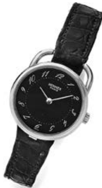
Hermès Arceau, n° 17608 Vers 1990 Montre en or jaune 18k Estimation : 1 000/1 500 €