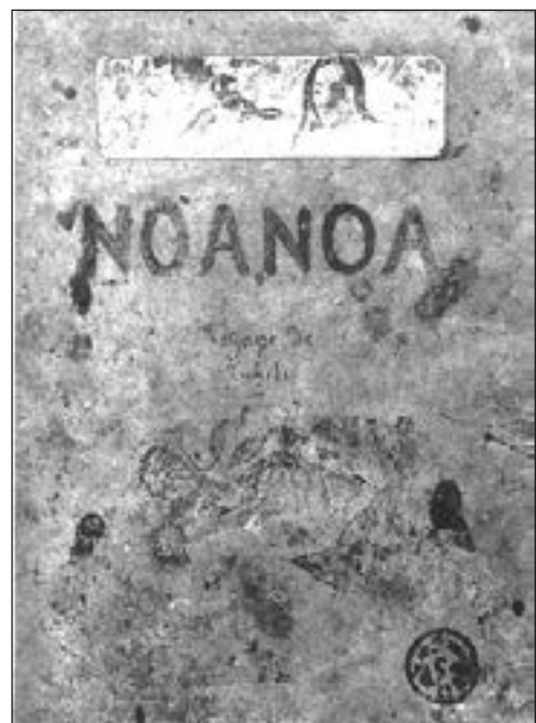
Coédition Rmn-Grand Palais / Les Éditions du Musée d'Orsay 216 pages - 190 €

Le fac-similé qui en est proposé aujourd'hui offre une version aussi fidèle que possible à l'original, en mettant au service de la qualité du rendu les papiers comme les techniques les plus pointues de l'imprimerie actuelle.