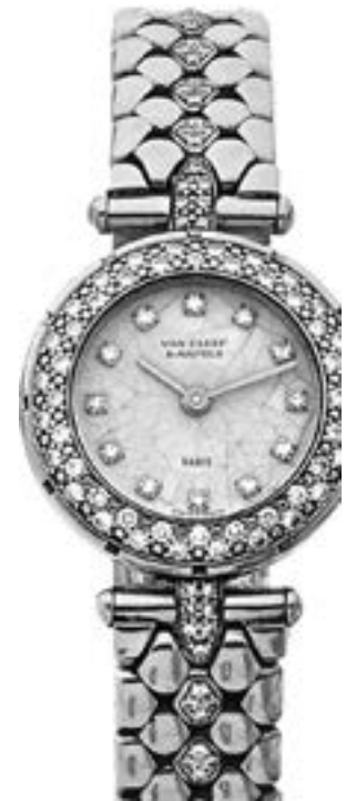
Van Cleef & Arpels Lady Arpels, n° 53804 Vers 1990 Montre en or jaune 18k et diamants Estimation : 3 000/4 000 €