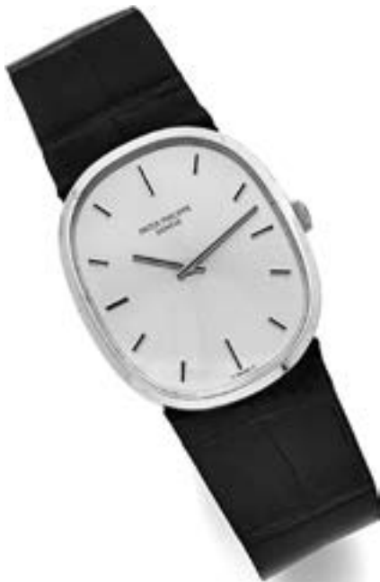
Patek Philippe Ellipse, ref. 3748, n° 1327528 / 537794 Vers 1978 Montre en or jaune 18k Estimation : 3 000/4 000 €