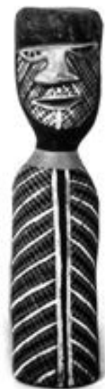
Anonyme Spirit Figure, sculpture Acrylique sur bois, 50 x 12 x 11cm Groupe Tiwi Estimation : 350/400 €