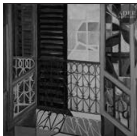
Balcons à Neuilly, 1954 Huile sur panneau Monogrammée, datée et située au dos 120 x 122 cm Estimation : 500/600 €