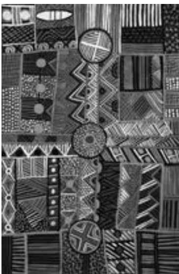
Maree Puruntatameri Sans titre Acrylique sur toile, 120 x 78 cm Groupe Tiwi Estimation : 900/1 100 €