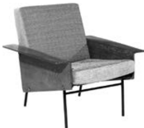
Pierre Guariche et Airbone (éditeur) Fauteuil bas «G10», création 1954 Panneaux en contreplaqué de chêne, assise et dossier en velours gris Estimation : 1 500/2 000 €