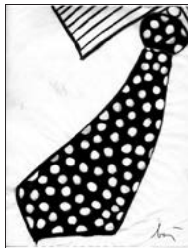
Enrico Baj. La cravate. Dessin original à l'encre et à la gouache signé au recto par Baj représentant sa célèbre cravate, reproduite entre autres dans la revue Phases. 28 x 22 cm sous encadrement Estimation : 1 200/1 500 €