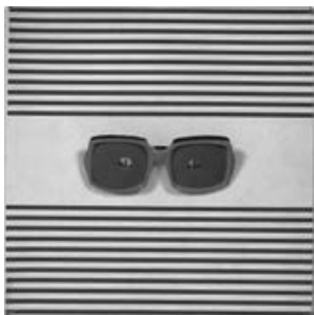
Isabelle Lemaître Vari-action I, Louvain La Neuve, avril 1982. Publication Pop, emboîtement original en carton contenant une paire de lunettes en plastique orangé Estimation : 150/200 €