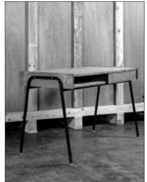
Bureau plat en bois naturel, ouvrant par un tiroir et un casier dans la ceinture, piètement métallique laqué noir en U inversé 75,5 x 120 x 60 cm Estimation : 100/120 €