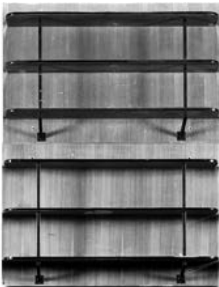
Deux étagères murales à trois rayonnages réunis par deux montants tubulaires laqués noir Placage de chêne blond 90x 136 x 24 cm Estimation : 100/150 €