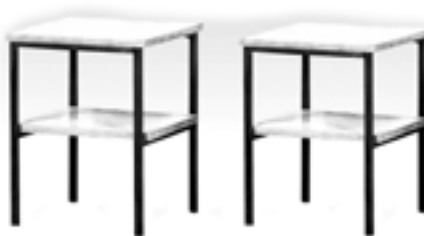
Deux chevet à deux plateaux stratifiés réunis par quatre pieds tubulaires en métal laqué noir Estimation : 30/40 €