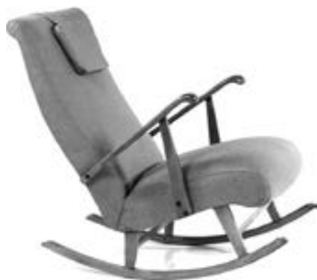
Jose Zanine Caldas Rocking chair, années 1950 Bois de Pau marfim et tissu Estimation : 800/1 200 €