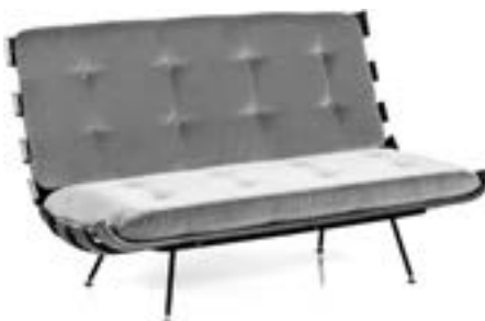
Carlo Hauner et Martin Eisler Canapé, années 1950 Modèle Costela, bois de caviuna, métal et tissu Estimation : 5 000/7 000 €