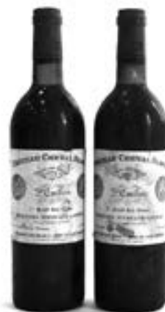
Deux bouteilles de Château Cheval Blanc, 1975 GCC1A Saint-Emilion Estimation : 350/380 €

■ Besch Cannes Auction - Tél. 04.93.99.33.49