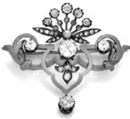
Broche en or jaune 18k et diamants Epoque Napoléon III Estimation : 1 800/2 200 €