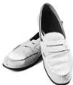
J.M Weston Paire de mocassins en veau grené atoll et veau camel, semelles en cuir Estimation : 120/150 €