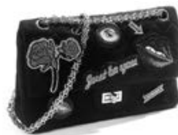
Anonyme. Sac d'inspiration "2.55" 25cm en jersey matelassé noir, agrémenté de patch et pins divers. Fermoir pivotant en métal doré sur rabat, anse chaîne réglable, poche extérieure Estimation : 550/650 €

■ Besch Cannes Auction - Tél. 04.93.99.33.49