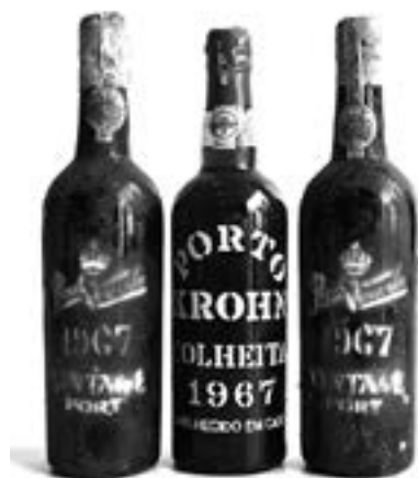
Lot Panaché. Deux bouteilles Porto Vintage 1967 Real Companhia Norte (Portugal). Une bouteille Porto Colheita 1967 Krohn (Portugal) (mise de 1987) Estimation : 240/270 €