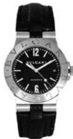
Montre Bulgari Diagono Montre acier, mouvement automatique, cadran noir avec index bâtons et chiffres arabes, guichet de date à 3 heures, bracelet cuir avec boucle deployante Estimation : 1 000/1 200 €

■ Besch Cannes Auction - Tél. 04.93.99.33.49