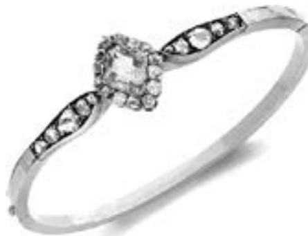
Bracelet jonc en or jaune orné d'une émeraude et de diamants. 19ème siècle Estimation : 2 000/2 500 €