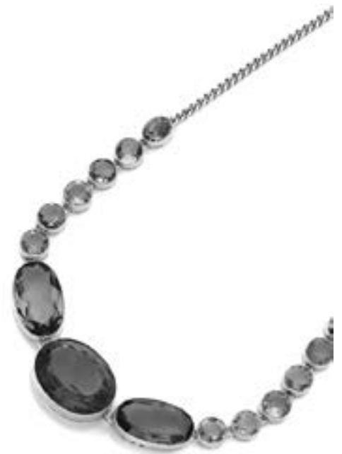
Collier en or jaune 14k agrémenté d'améthystes Estimation : 800/1 000 €