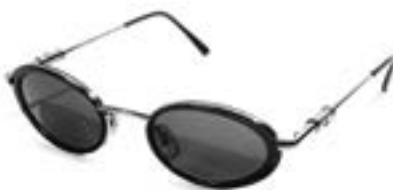
Gianni Versace Paire de lunettes de soleil en résine noire, verres fumés, branches en métal argenté Estimation : 50/60 €