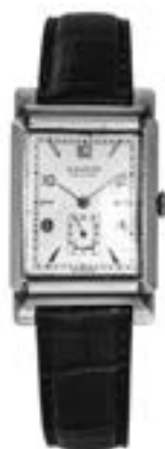
Montre Movado vers 1940 Montre rectangulaire acier N°394123, mouvement mécanique, cadran argent avec index bâtons et chiffres arabes rapportés, petite trotteuse à 6h, bracelet cuir avec boucle ardillon Estimation : 800/900 €