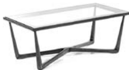
Giuseppe Scapinelli Table basse, années 1950 Bois de caviuna et verre Estimation : 1 800/2 200 €