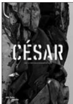
Éditions du Centre Pompidou 256 pages - 39,90 €

Première anthologie de cette ampleur, cet ouvrage a vocation à devenir une référence scientifique sur l'artiste, amendée par sa dernière compagnie et ayant-droit.