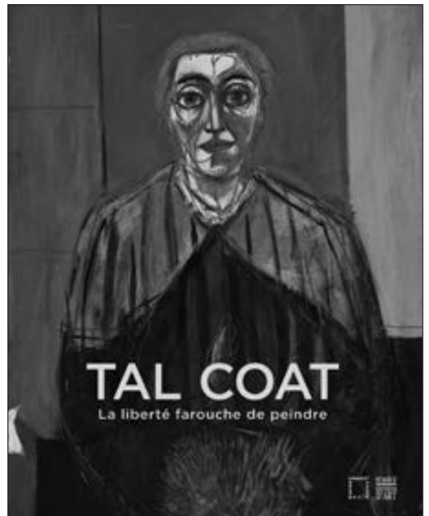
Coédition musée Granet, Aix-en-Provence / Somogy éditions d'Art 184 pages - 29 €

Riche de près de 200 reproductions et documents, de textes de l'artiste lui-même, il rassemble des contributions de connaisseurs de son œuvre, venus d'horizons très divers et réunis par Jean-Pascal Léger.