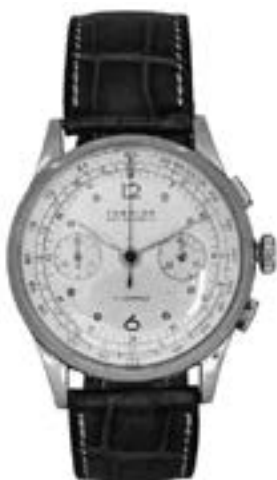
Montre Formida, vers 1950 Montre chronographe en or rose N°35615, mouvement mécanique, cadran argent à double compteurs, télémètre en impression, bracelet cuir avec boucle ardillon Estimation : 400/500 €