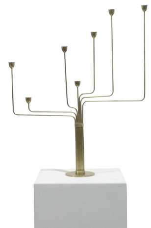
Piet Hein Chandelier modèle "Ursa Major" Laiton, à sept bras de lumière Circa 1955 Estimation : 800 - 1.200 €