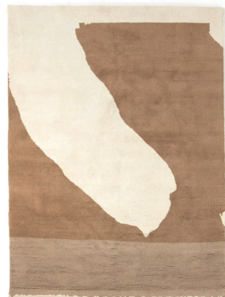
Robert Motherwell. Tapis en laine, modèle «Beige Figuration». Édition Modern Masters Tapestries. Modèle créé en 1975. Monogrammé au revers Estimation : 4.000 - 6.000 €