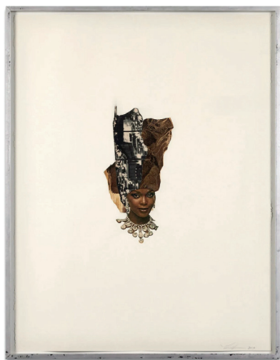
Lorna Simpson «Riunite & Ice, collage #12», 2014 Collage sur papier Signé et daté Estimation : 8.000 - 12.000 €