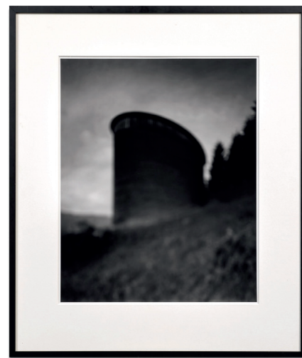
Hiroshi Sugimoto «Saint Benedict Chapel, Peter Zumthor», 2000 Tirage photographique en noir et blanc Édition «8/25» Estimation : 7.000 - 9.000 €