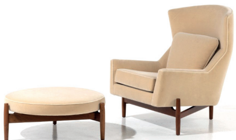
Jens Risom - Fauteuil et ottoman Noyer et textile - Édition Risom Designs Modèle créé vers 1960 Estimation : 7.000 - 9.000 €