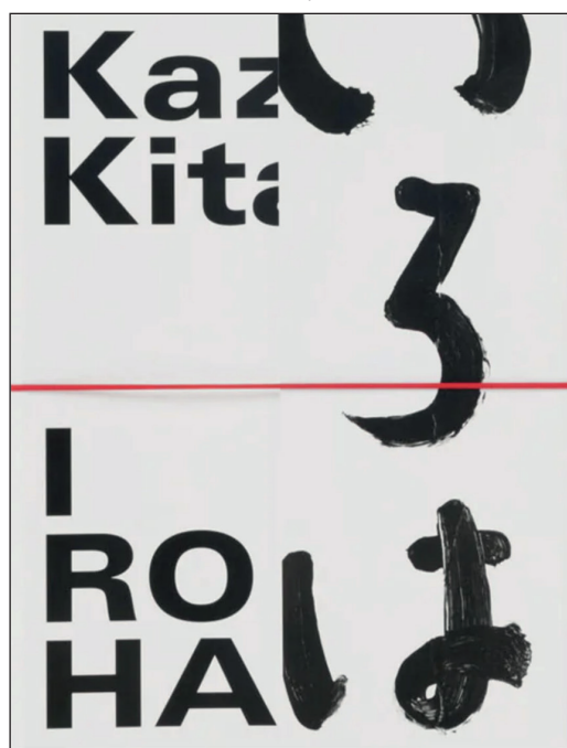
Éditions Chose Commune - 80 pages - 42 €

tion, l'image un support pour une forme hybride, entre calligraphie et peinture.