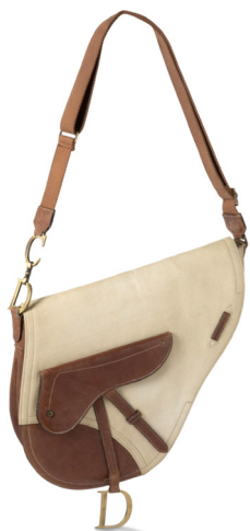
Dior - Sac « Saddle », vintage Toile beige et cuir marron. Sangle ajustable en tissu marron et garniture en métal doré Intérieur en daim et toile siglée marron. Etat d'usage - Environ 31 x 32 x 3 cm Estimation : 500 - 700 €