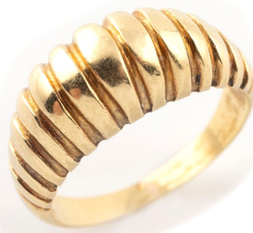
Bague à godrons en or 750 millièmes TDD 54 Poids : 3,9 grammes