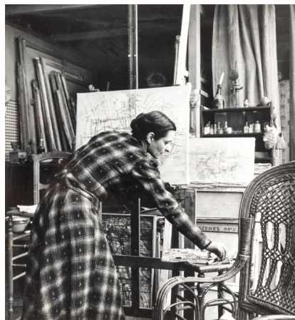
Willy Maywald Maria Helena Vieira Da Silva dans son atelier, 1949 Épreuve argentique, vers 1970, montée sur carton Tampon du photographe au dos du montage 33.2 x 30.7 cm Estimation : 100 - 150 €

Des photographies d'artistes par Willy Maywald Paris, lundi 13 mai