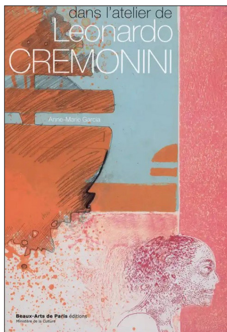
Éditions des Beaux-Arts de Paris - 391 pages - 39 €

Il est lié, entre autres, aux peintres Francis Bacon, Balthus, Roberto Matta, Karl Plattner, Zao Wou-Ki.