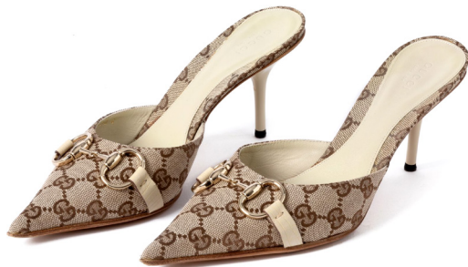
Gucci Paire d'escarpins en toile monogrammée «GG» Beige et marron, bouts pointus Talons 8 cm, semelle en cuir Taille 38 Estimation : 150 - 200 €