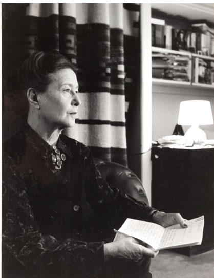
Willy Maywald Simone de Beauvoir, vers 1955 Épreuve argentique, vers 1970, montée sur carton Titre à l'encre au recto et tampon du photographe au dos du montage 40.5 x 31 cm Estimation : 100 - 150 €

■ Drouot Estimations - Tél. : 01.48.01.91.00