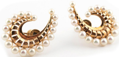
Paire de boucles d'oreilles volute en or 585 millièmes rehaussées d'une chute de perle de culture Circa 1950 - H. : 3 cm. Poids brut : 10,2 grammes Estimation : 300 - 500 €

■ Deburax - Du Plessis - Tél. : 01.42.24.72.22